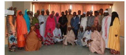
©Participants à la formation de sur le Transfert de Connaissances à Bauchi

Du 3 au 5 novembre 2016, l'équipe de recherche de la FOWMAN et toutes les parties prenantes ont bénéficié d'un renforcement de capacités en transfert et applications de connaissances.